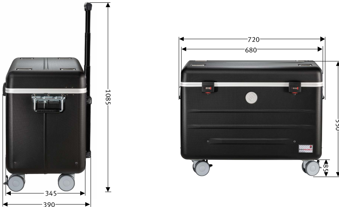
Abmessungen außen in mm